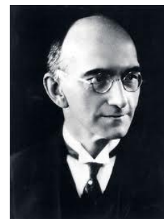
Paul Rivet (1876 - 1958)