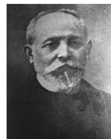
Florentino Ameghino (1854 - 1911)

4) Australianos: alcanzaron por la Antártida en el 500 las tierras de América del Sur.